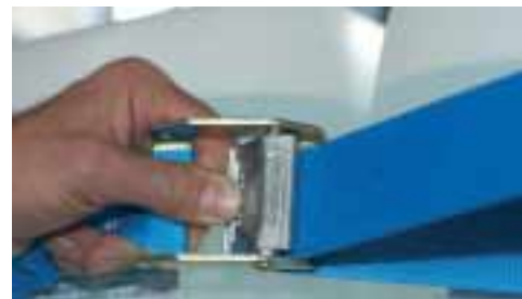
Einfach zu bedienen, sparsam und flexibel. Gerade im Vergleich mit Einwegverpackungen kommen Zurrgurte gut weg.

Flexibilität nach Maß: Sie können jederzeit und überall Waren von einer Palette entnehmen. Anschließend werden die Gurte einfach wieder geschlossen und nachgespannt. Ohne Verpackungsmüll oder Zeitraubende Wege zur Verpackungsmaschine, um die Palette neu zu verschürren bzw. mit Folie zu umwickeln.