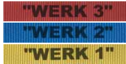
Bedruckt oder aufgewebt. Auf Wunsch bedrucken wir die Gurte mit Logo, Namen oder anderen Hinweisen wie: Nur zum internen Gebrauch, Lackierung, Montage, Ware für Werk 2 etc.