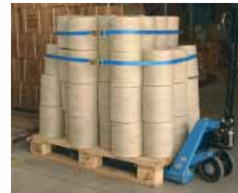
Runde Sache: Bei schweren Gegenständen wie diesen Garmrollen genügt es oft, die obere Lage zu verzurren, um die ganze Palette standfest zu machen. Ideal für diese Anwendung sind kleine Ratschen, die mehr Zugkraft aushalten.