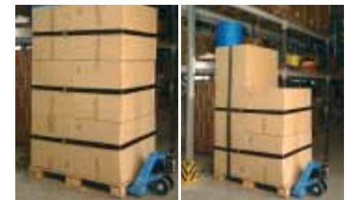
Wenn ein Karton aus der Palette entnommen wird, werden die restlichen einfach neu verzurt. Ideal für diese Aufgabe: Zurrgurte mit Steckschlössern oder Klettgurte.