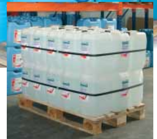
Die Kanister dürfen nicht herunterfallen, sollen aber auch nicht eingedrückt bzw. beschädigt werden. In der Regel genügt ein breiter Klettgurt pro Lage, um diese Aufgabe zu meistern.

Auch für Sonderaufgaben sind wir gerüstet: Zum Beispiel bieten wir Ratschen, die auch Ammoniak, aggressiven Säuren und Salzwasser standhalten.